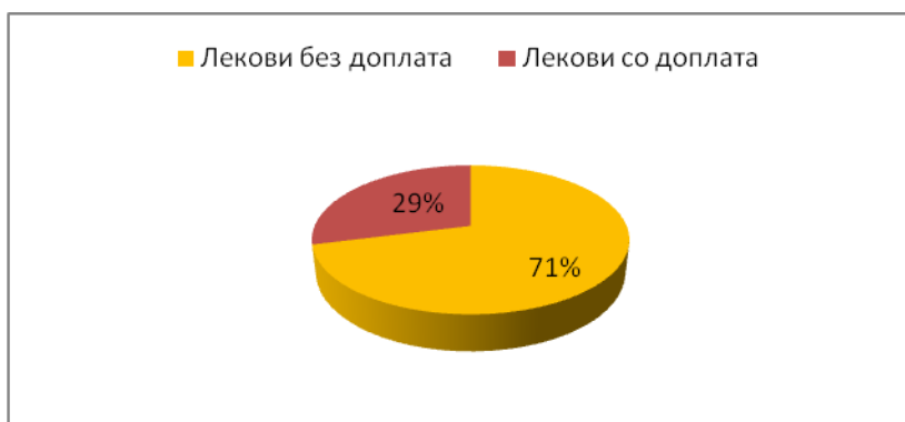
График 1. Споредба на референтни цени на лекови по генерики 2012 година

лекови до овој момент, односно приближно 3% раст во 2012 година. За споредба, во 2009 година бројката на лекови без доплата беше 77, и се бележи значителен раст од 3,5 пати на лековите без доплата по имплементација на компаративната методологија на Фондот за референтни цени на лекови. Сумарно, од 2009 година кога бројката на лекови по генерики без доплата била 20%, во 2012 година е 71%, односно се бележи раст од 51%. Постои тенденција овој број да се зголемува и понатаму.